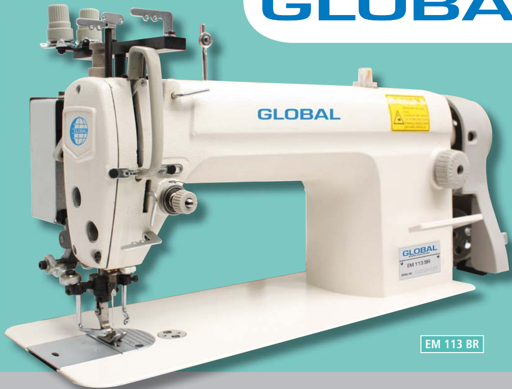
EM 113 BR