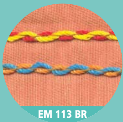
EM 113 BR