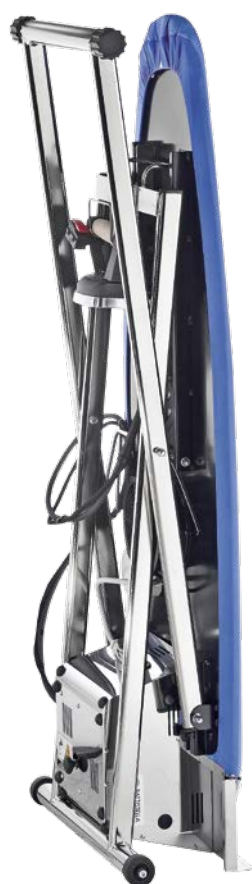
Chiuso - Closed

Accessori applicabili a richiesta Accessories available by request