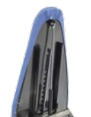
Molla a gas Gas spring