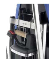
Supporto ferro Iron support