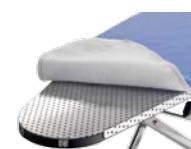
Piano stiro in alluminio Aluminium ironing board